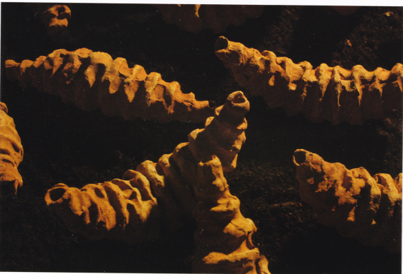
Ličinke i crveni trosjed, 2012. zemlja, glina, drvo, tekstil, 810 x 640 x 170 cm; ličinke 40 x 10 x 10 cm 700 skulptura; trosjed 170 x 80 x 80 cm, zemlja 2 m 3

Instalacija Metamorfoze skulptora Maka Melchera sastoji se od razmjeno jednostavnih elemenata – zemljane podloge, crvenog trosjeda i niza uvećanih ličinki od terakote. U svemu tome moguće je učitati brojne konotacije. Prva dolazi do nas na bazi ljudske urođene, negativne reakcije naspram svijeta kukaca i njihovih životnih ciklusa. To je kao nekakav strah od organskog koje je sitno i nalazi svoj put na najrazličitijim mjestima, a najčešće u prljavštini i truleži, odnosno u mrtvom svijetu. Ličinka i njezine