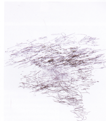
Impulsi, 2012. penkala 148 x 210 mm

Impulsi vožnje, Galerija Matice hrvatske Zagreb, kolovoz/rujan 2012.